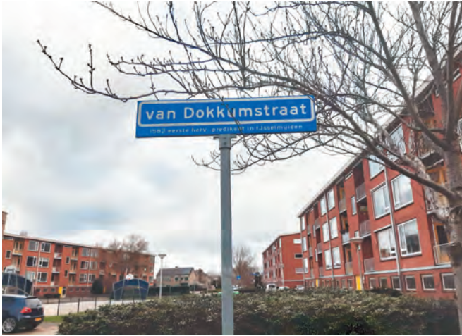
Stratenaambordje van de Van Dokkumstraat in IJsselmuiden.

formatie is dan geschiedenis, al heeft deze wel diepe sporen nagelaten. Uiteraard zijn er inwoners van IJsselmuiden die niet zijn overgegaan naar de protestantse kerk. Zij blijven trouw aan de Rooms-Katholieke Kerk en hebben het lange tijd moeilijk. In Kampen komen zij in schuilkerken bijeen, totdat in 1810 de Buitenkerk in gebruik kan worden genomen. Pas in het jaar 1857 wordt de rooms-katholieke parochie IJsselmuiden gesticht door aartsbisschop Johannes Zwijsen en is toegewijd aan Onze Lieve Vrouw Onbevleete Ontvangen. Een eigen kerk wordt in 1859 gebouwd en zestig jaar later herbouwd. 32