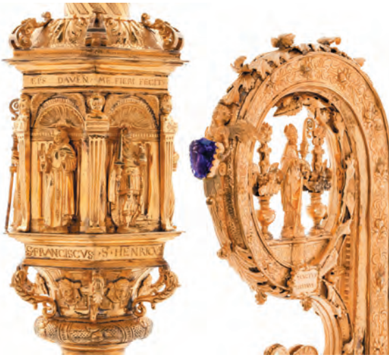
Detail van de staf van de bisschop van Deventer. In 1570 vervaardigd voor de franciscaan Aegidius de Monte, die in dat jaar bisschop van Deventer werd. Op de nodus ('knoop') ziet men in nissen verguld zilveren beeldjes van heiligen, onder wie Aegidius en Franciscus. Bovenin staat Lebuinus, patroon van Deventer. De Latijnse tekst op de achterzijde betekent: 'Het is zaliger te geven dan te ontvangen.' Collectie Museum Catharijneconvent, Utrecht; foto: Ruben de Heer.