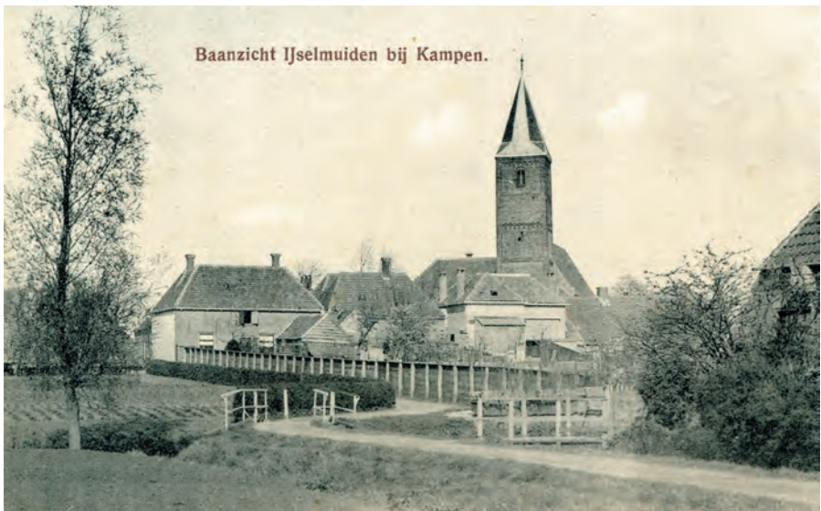
Up den dorpen. Zicht op IJsselmuiden vanaf de Baan rond 1900. Ansichtkaart.