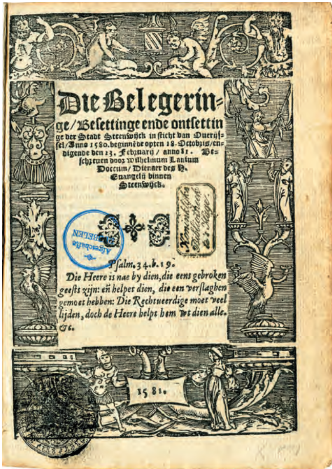
De titelpagina van Lanius' boekje Die belegeringe, besettinge ende ontsettinge der stad Steenwijk .

Van 18 oktober 1580 tot 23 februari 1581 vindt de belegering van de stad Steenwijk door de Spanjaarden plaats. In deze periode wordt het leven beheerst door beschietingen, aanvallen, uitvallen, verdedigen en hongerslijden. Er vallen vele doden ten gevolge van oorlogsgeweld en pest. De toenmalige stadssecretaris spreekt zelfs van zevenhonderd slachtoffers.