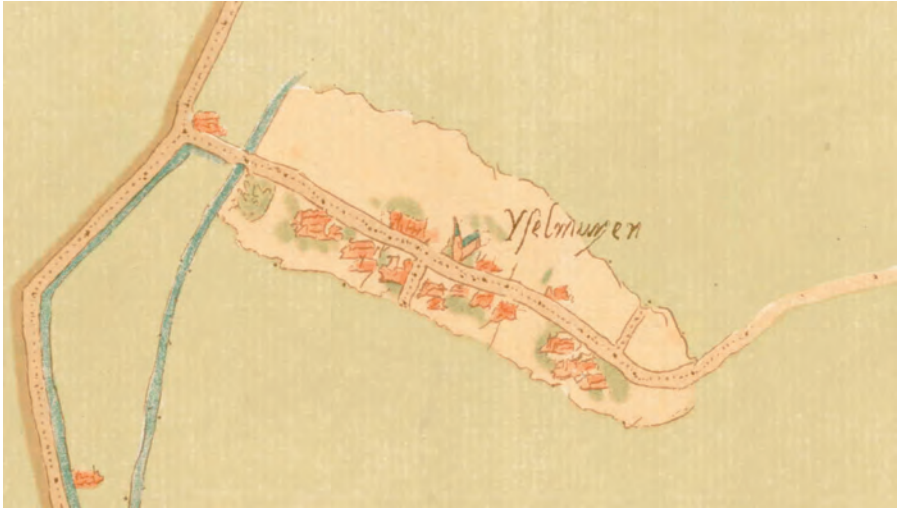
IJsselmuiden. Detail van de plattegrond van de stad Kampen en omgeving door Jacob van Deventer. 1557-1558. Historisch Centrum Overijssel. Kaartencollectie nr. 302.

het eind van de 10de eeuw, nadat de landsheerlijke rechten over de nog onontgonnen gebieden bij de monding van de IJssel door de Duitse vorst aan de bisschop van Utrecht waren geschonken, werd de ontginning gestimuleerd. De relatief hooggelegen rivierduinen werden uitgekozen als nederzettingen, en dienden als basis voor het in cultuur brengen van de oostelijke IJsseloever. 1