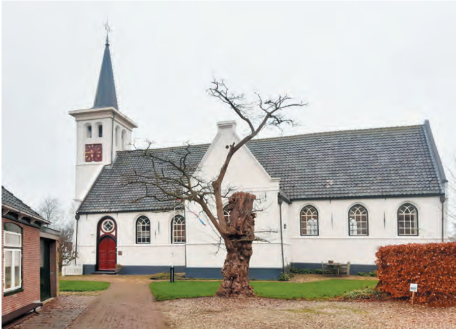
Hervormde Kerk te Hauwert anno 2020.

van de Nationale Synode te Dordrecht, gehouden in 1578. 15 Wilhelmus Lanius Doccum, 'Verbi Minister in Hauwert', ondertekent op 27 mei 1578 een kredietbrief waarmee de classis Hoorn drie broeders zendt naar de Nationale Dordtsche Synode. Aan de hand van deze vermelding weten we dus dat Wilhelmus Lanius in 1578 predikant is van de Noord-Hollandse gemeente Hauwert, uit de Classis Hoorn. Gegevens over zijn leven vóór dit jaar zijn ons onbekend.