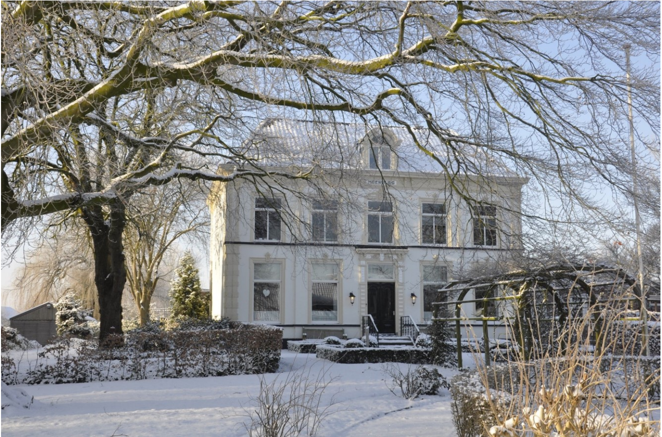
Huize Meerburg in de 21 e eeuw