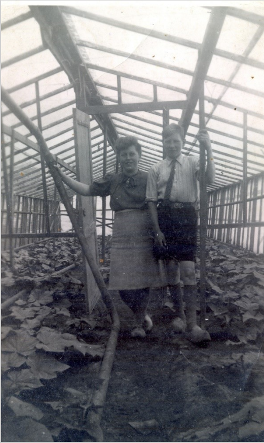
De kinderen helpen al jong mee