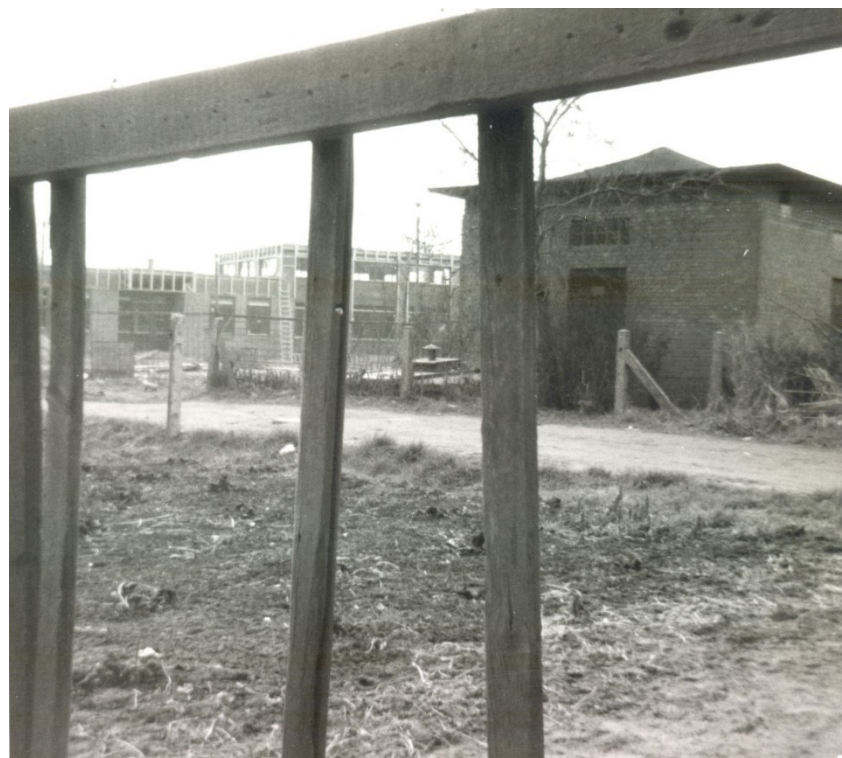
Op de achtergrond de nieuwbouw van de IJsselburg in 1974-1975 en rechts het 'knetterhuusien'...