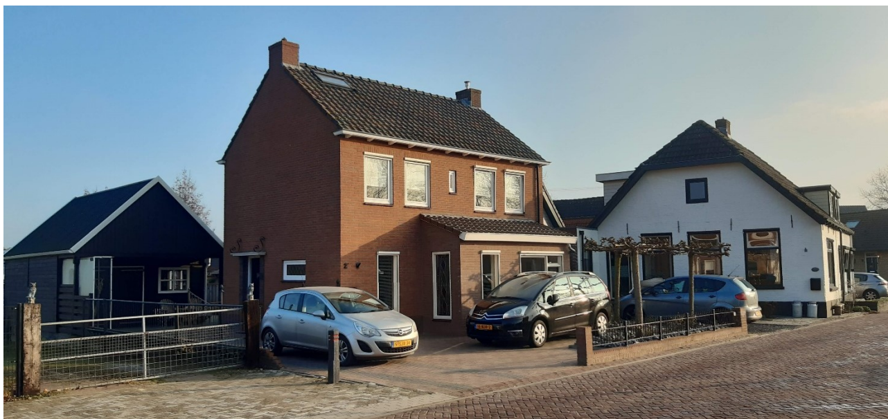
Kerkepad 2a - foto 2022