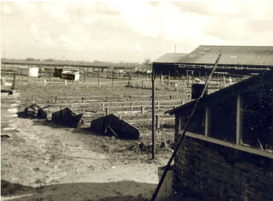
Achter op het land. Rechts in de verte de manege

Harm Jan Selles is geboren op 11 november 1918 en overleden op 8 januari 1978. Teuntje is geboren op 6 februari 1928 en overleden op 8 mei 2017 aan de Tuinfluiter te IJsselmuiden. In hetzelfde jaar 1978 worden de buurvrouwen (en schoonzussen) al vrij jong weduwe.