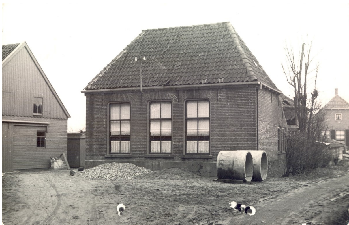
Kerkepad 2 met links de nieuwe schuur van 1953 (rechts op de achtergrond Kerkepad 4)