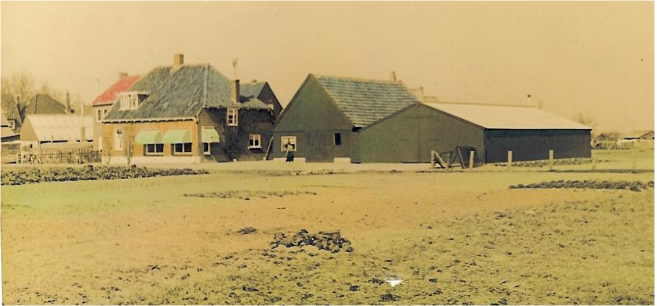
Zicht op Kerkepad 4 en 6 vanaf de Evertshof. Foto is van begin jaren 60.