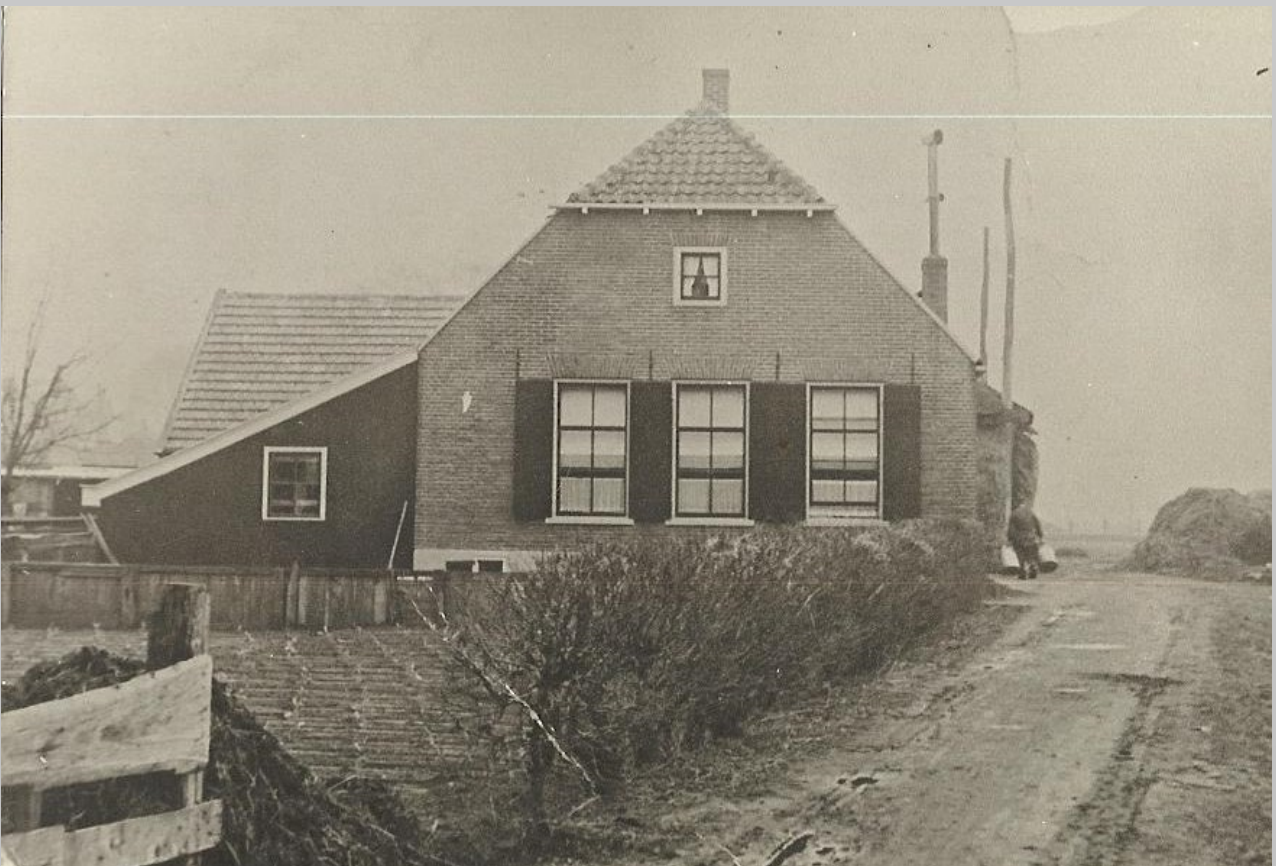
Kerkepad 4 vlak voor WO II