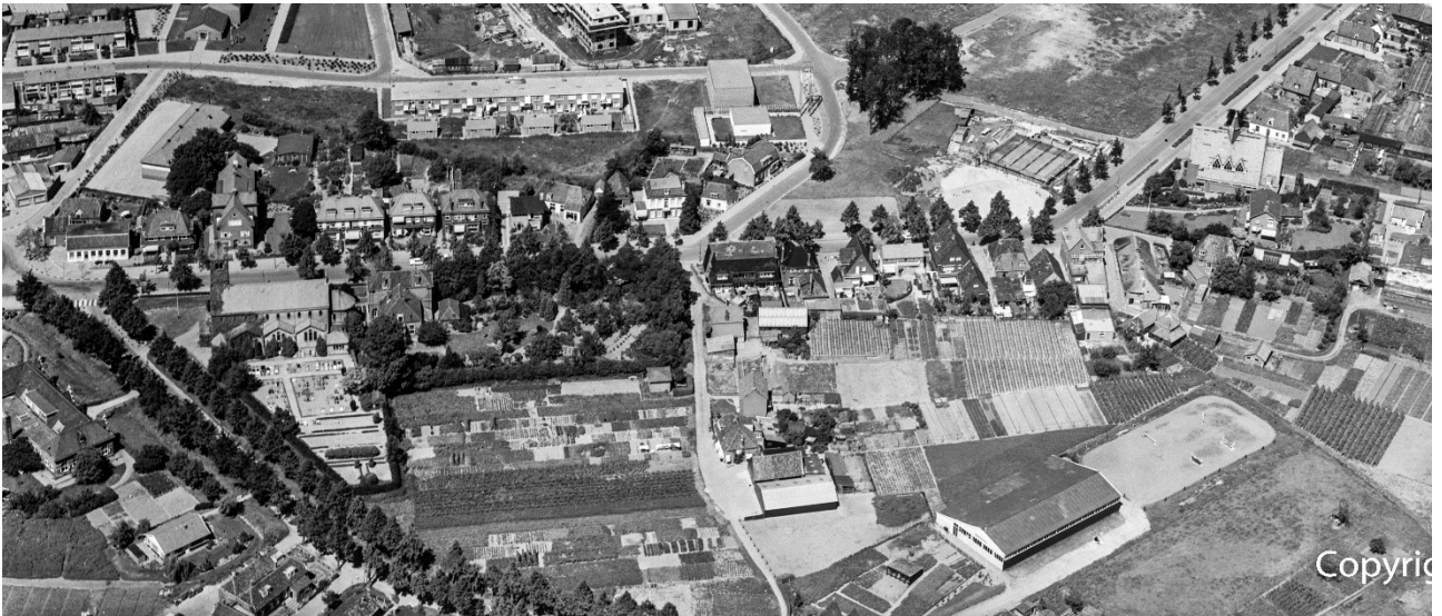
Details van twee schitterende luchtfoto's uit 1963.

Beide tuindersbedrijven (Harm Jan Selles en Anton Brink) zijn nog volop in bedrijf en ook de hele Evertshof is in gebruik. We zien het Kerkepad met een slinger naar links uitkomen naast het huis Oosterholtseweg 4.