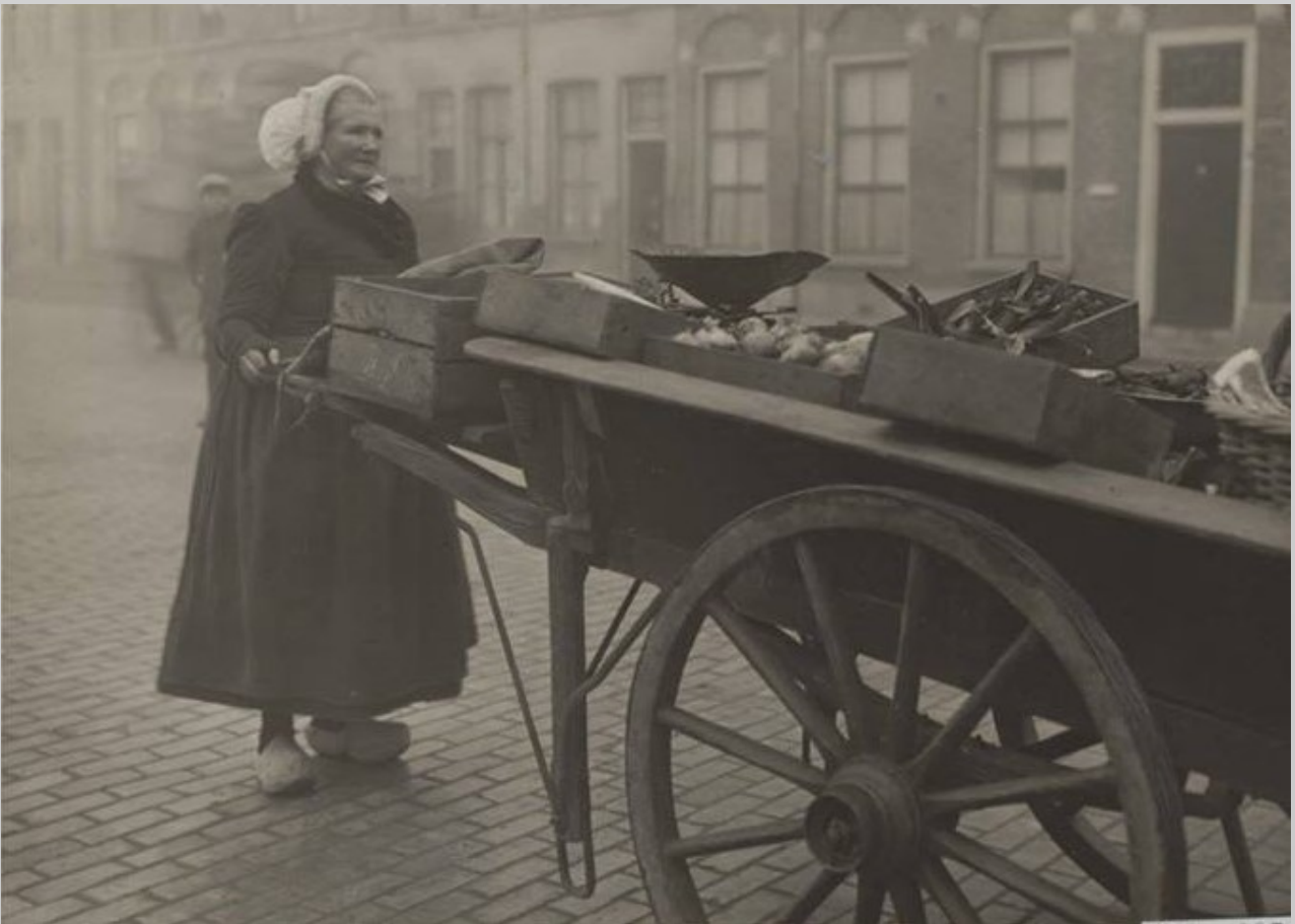
Remmeltje achter haar handkar